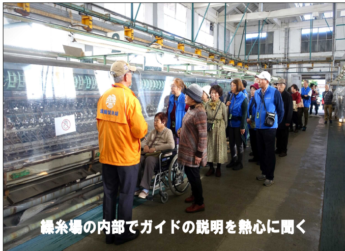
繰糸場の内部でガイドの説明を熱心に聞く

一人では遠方への外出が思うようにできない方、足の不自由な方などを介護付きで話題の場所へご案内する「お出かけサポート」。この11月24日は少し足を伸ばして世界遺産「富岡製糸場」と紅葉シーズンにお花見が楽しめる冬