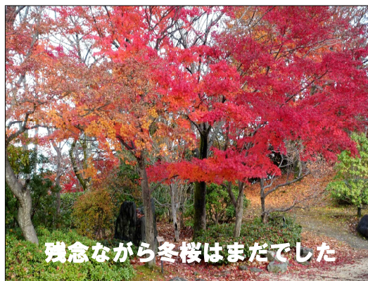
残念ながら冬桜はまだでした

NPO総ぐるみ福祉の会 所在地：「京急ニュータウン」バス終点 徒歩2分 住所 横浜市港南区日限山4-39-19 日限山ハイツ101号室 電話 045-846-8850 FAX 045-370-7272