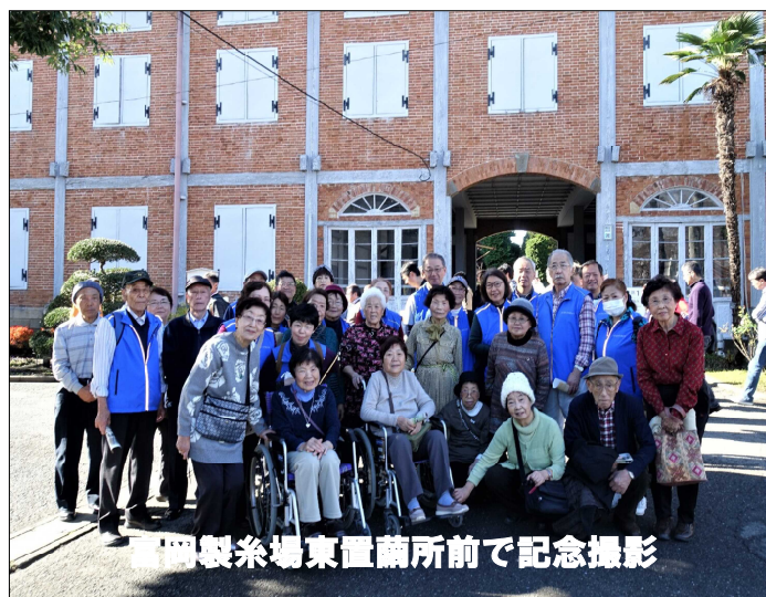
富岡製糸場東置繭所前で記念撮影

桜で有名な「桜山公園」を訪れました。当会の「お出かけサポート」の特長は単なるバス旅行ではなく、日頃、介護サービスのため利用者様のお宅へ訪問しているヘルパーの皆さんにも参加してもらうこと。これがなかなかの評判で、利用者の方々か