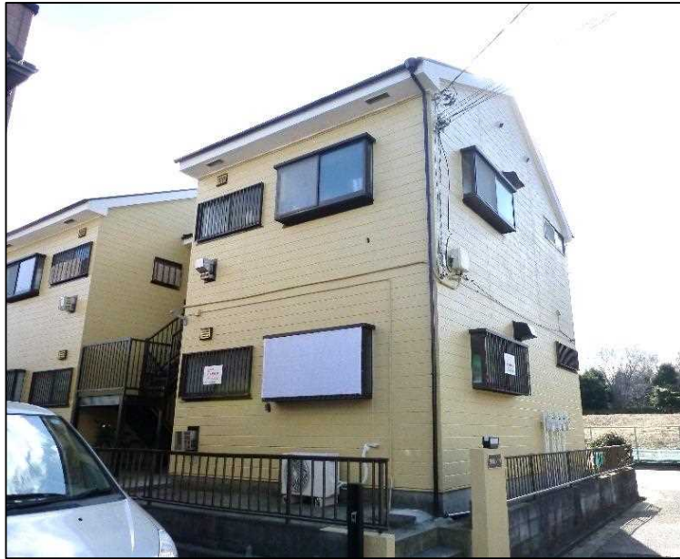
〒233-0015 横浜市港南区日限山 4-39-19 日限山ハイツ

1月18日、NPO総ぐるみ福祉の会の事務所を移転しました。新しい事務所は旧事務所から約30メートル南の筋向かい「日限山ハイツ」の101号室で、今までの事務所からもよく見えていた所です。新事務所は日限山4丁目の一